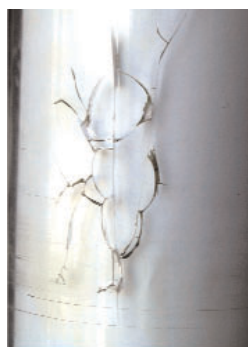
Haarrisse entstehen z.B. durch chemische Reinigungsmittel