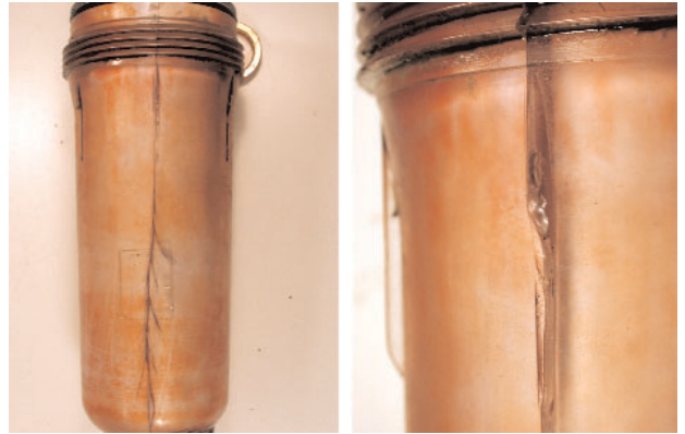
Abgebrochener Haltenocken durch unsachgemässes Öffnen der Filtertasse

Kunststoffe sind je nach ihrer Zusammensetzung anfällig auf chemische Einflüsse wie z. B. Reinigungsmittel. Vor allem sind jene ungeeignet welche Alkohol oder Lösungsmittel enthalten. Im Weiteren können auch Waschmittel, welche Tenside enthalten, für Kunststoffe gefährlich werden, da die Einwirkung von Tensiden den Kunststoff zu zersetzen beginnt. Diese Einwirkungen verursachen an den Filtertassen Haarrisse, welche dann zu einem Bruch der Tasse und in der Folge zu einem Wasserschaden führen. Aus diesem Grunde dürfen die Kunststoff Filtertassen nur mit Wasser gereinigt werden.